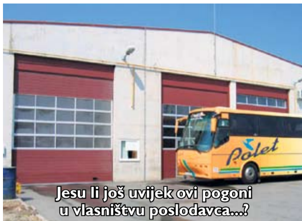
Jesu li još uvijek ovi pogoni u vlasništvu poslodavca...?

Budući da nismo zaboravili naše kolege koji su ovih dana još uvijek u velikoj neizvjesnosti hoće li dobiti sudski spor s poslodavcem ili ne, otvaramo internetsku stranicu na kojoj se reklamira tvrtka Polet d.o.o. iz Vinkovaca. Iako im je stanica skromna, ipak je puna lijepih fotografija autobusa koji i nisu u funkciji gradskog prijevoza, koji budu iznajmljivani za sasvim druge potrebe, a voze ih samo poslušni, podobni vozači, koji ne razmišljaju zdravo, već na način gospodina direktora, koji je uvijek u pravu. Gleđao sam tog šezdesetpetogodišnjaka, onako oronulog, jadnog i nikakvog kako i nadalje vodi zločestu politiku protiv vozača koji su se drznuli ukazati mu na potrebu, na zakonsku obvezu koju evidentno ne poštuje, već raznim smicalicama narušava opće poslovanje, zdravlje i sigurnost svojih radnika, ali i u prijevozu građana grada Vinkovaca kao i obližnjih mjesta na kojim područjima obnaša javni prijevoz. Naravno, pitanja se sama nameću, tko stoji iza gospodina direktora, kada znamo da smo sa svim problemima upoznivali određene institucije, MUP RH, PP Vinkovce, Gradsko poglavarstvo Grada Vinkovaca te samog gradonačelnika. Uvidjevši da nemamo razumijevanje, potporu na vapaj koji smo odašiljali na razne adrese, javili smo se novinarima javnih tiskovina i medija i za to bude-