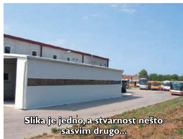
Slika je jedno, a stvarnost nešto sasvim drugo...