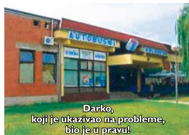
Darko, koji je ukazivao na probleme, bio je u pravu!