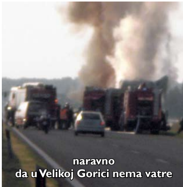
naravno da u Velikoj Gorici nema vatre

Iako ovaj pogon slovi kao mali pogon, to nikako svojim pristupom radnim obvezama ne pokazuje, već naprotiv. U vrlo teškim uvjetima, na rubu rentabilnosti poslovanja, stalne prijetnje i političkih zbivanja, radnici obavljaju uredno svakodnevno svoje radne obveze. Ovaj sindikat u svojstvu izabranog Izvršnog odbora zagovara potrebu dodatnog ulaganja, rješavanja pitanja postojanosti samog pogona o čemu nije potrebno previše govoriti treba li ili ne ovakav pogon u samoj Velikoj Gorici. Uza sva podmetanja i razne neobjektivne priče, većina naših radnika, članova ovog sindikata podržavaju nastojanja koja se vode, da pogon autobusa bude i nadalje u Velikoj Gorici. Polemika koja je u samom završetku ovog sastanka započela, bila je u pravcu poštivanja zakonskih pretpostavki, poglavito ukazom samog rukovoditelja na brzinu kretanja, tj. vožnje pojedinih vozača koji se tih obveza ne pridržavaju. Budući da je pogon autobusa u Velikoj Gorici dobio već duže vrijeme traženu osobu u svojstvu predstavnika poslodavca, danas svjedočimo toj aktivnosti da je na mjesto obavljanju dužnosti šefa pogona imenovan g. Ivan Ivančić. Isti se predstavio članovima ovog Izvršnog odbora izvijestivši ih o dosadašnjem radu