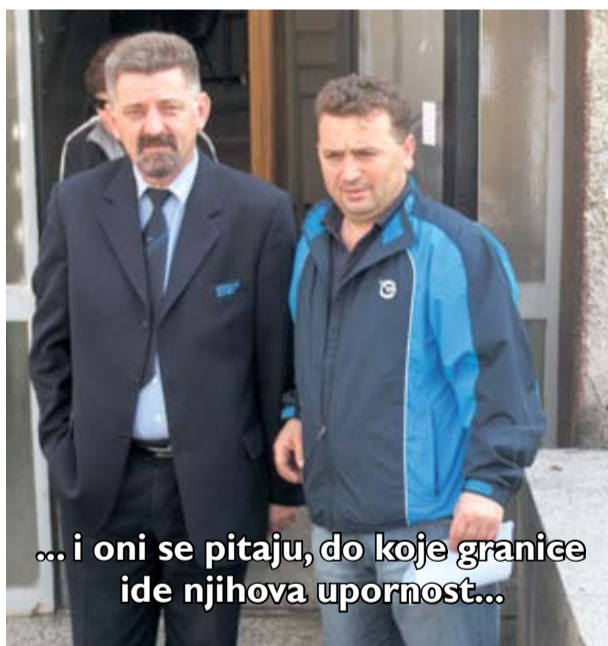
... i oni se pitaju, do koje granice ide njihova upornost...

U kratkim crtama upoznao je predstavnike poslodavca s aktualnim zbivanjima te problemima s kojima se susreću radnici ovog pogona. Naravno, stanje koje je i danas problematično nije nepoznata, naprotiv, zbilja već više od desetak godina traje kaotična situacija koju jednostavno ovi radnici danas proživljavaju. Mnoga obećanja svih ovih godina nisu urodila nekim vidljivim napretkom, iako se u zadnje vrijeme pokušava određenim alternativnim rješenjima poboljšati stanje, kako pogona, tako i autobusa. Vozači s pravom očekuju, naravno, i radnici u servisu, bolja vozila, poglavito vozila iz novog programa MAN-a i Mercedes-a. Vjeruju da će i poslodavac kao i aktualna politika u Velikoj Gorici razriješiti enigmno postojanja ovog pogona o kojem se često govori pozitivno ili negativno, ovisno o potrebi i trendu političkih previranja. Na žalost, radnici sve to moraju otrpjeti ispunjavajući svoje svakodnevne radne obveze na zadovoljstvo većine naših korisnika. Koliko možemo dijeliti zadovoljstvo u tehničkoj ispravnosti postojećih autobusa, pokazatelj je stanje i broj rasporeda te redovitost samih izlazaka na autobusne linije. Za ne povjerovati, danas autobusa imamo i u pričuvi. Od svih autobusa u najlošijem su stanju GB 803, 804, 805. Tražili smo od rukovoditelja da razgovara sa šefom servisa i da se pripreme autobusi za zimu, a nama je bitno pored