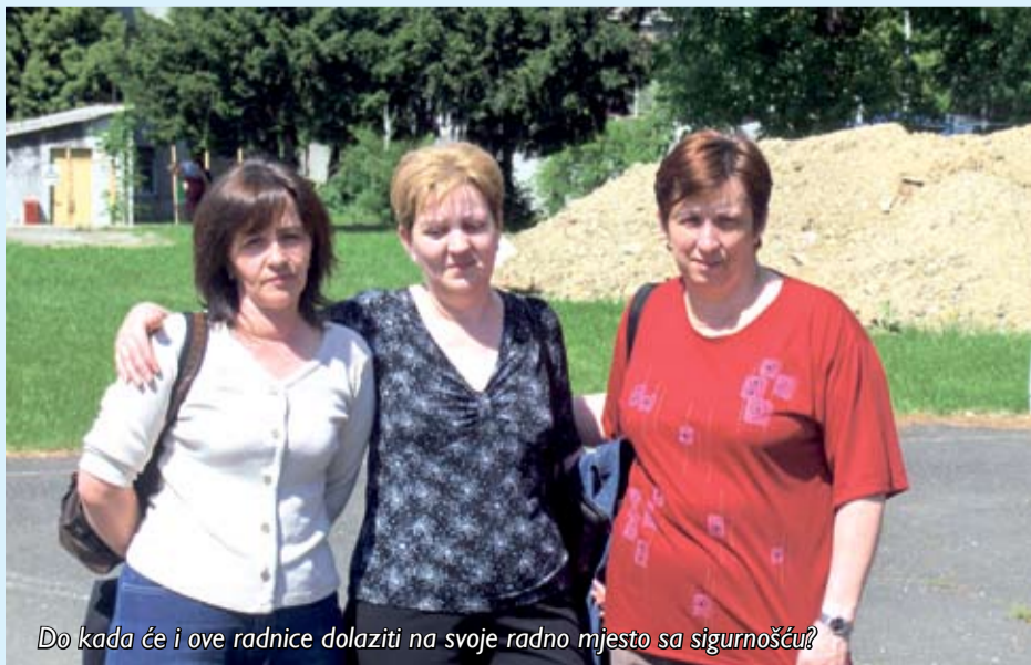
Do kada će i ove radnice dolaziti na svoje radno mjesto sa sigurnošću?

Često svjedočimo zadnjim posmrtnim oproštajima prijatelja, kolegica i kolega, što je to zapravo čovjek, zar su potrebna svakodnevna podmetanja, a život je tako kratak... (v.š.)