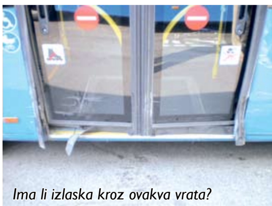
Ima li izlaska kroz ovakva vrata?