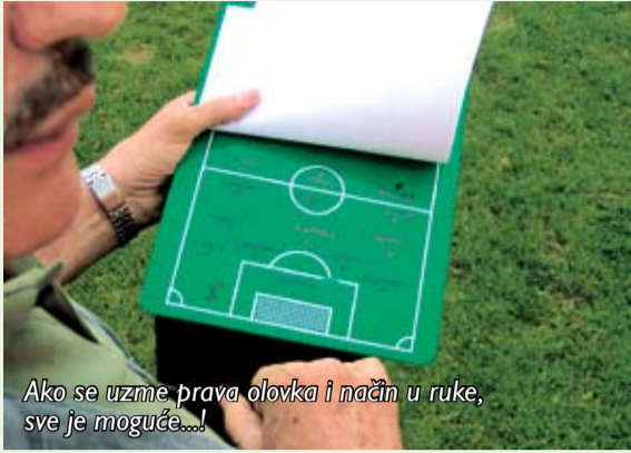
Ako se uzme prava olovka i način u ruke, sve je moguće...!

Nadamo se da je dojava valjana te se u svakom slučaju pridružujemo pohvali prema rukovodstvu autobusnog pogona iz Podsuseda. (v.š.)