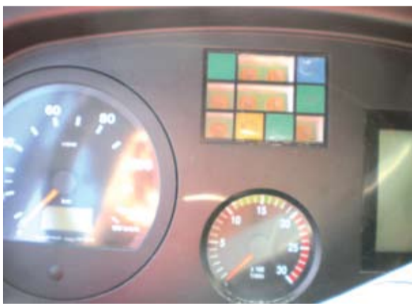
Gospodo, vrijeme vam neumorno otkucava!

U Zakonu je jasno rečeno da se godišnji odmor mora koristiti, da ga se radnik ne može odreći, a niti se za isti može isplatiti odšteta ili naknada, a svaki dokument koji govori o odricanju je ništavan. Na takav oglas u pogonima ZET-a, a i na objavu u ovom glasniku nitko od nadležnih se nije oglasio do danas.