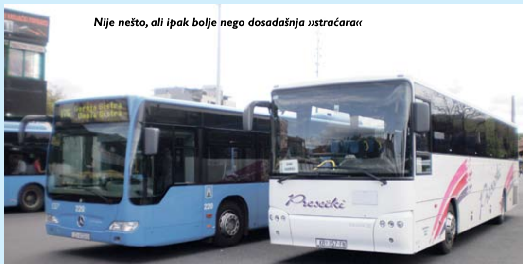
Nije nešto, ali ipak bolje nego dosadašnja »stračara«