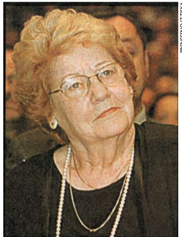
PRENESENO IZ TISKA