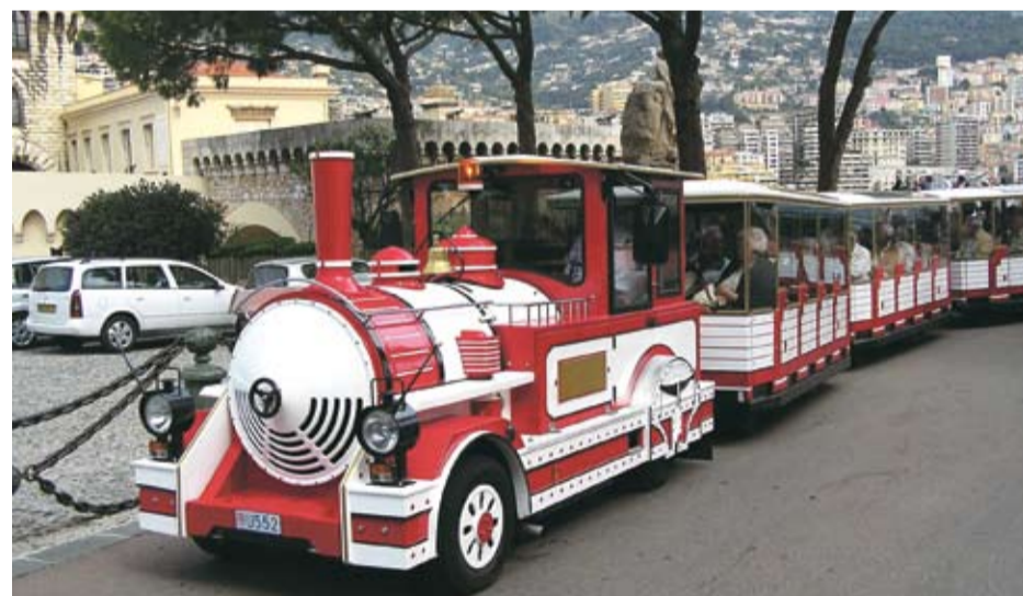
MONTE CARLO, Monaco

smijemo li se upitati, koliko ovaj milijunčak voza, a koliko stoji u servisu