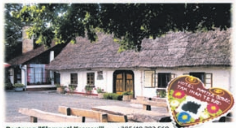
Restoran "Slamnat Krovovi" TEL: +385/49 282 569