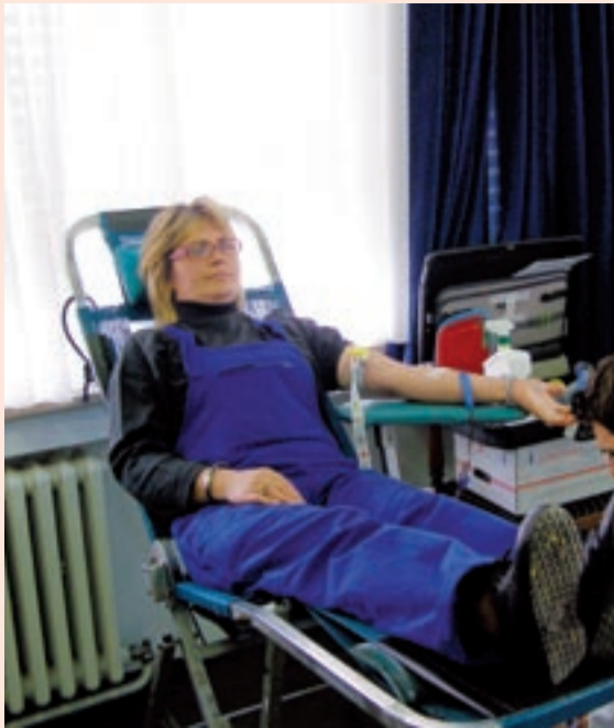
U petak, 3. travnja organizirano je dragovoljno darivanje krvi u Podružnici ZET. Dragovoljno darivanje krvi organizirano je na tri lokacije i to na Remizi od