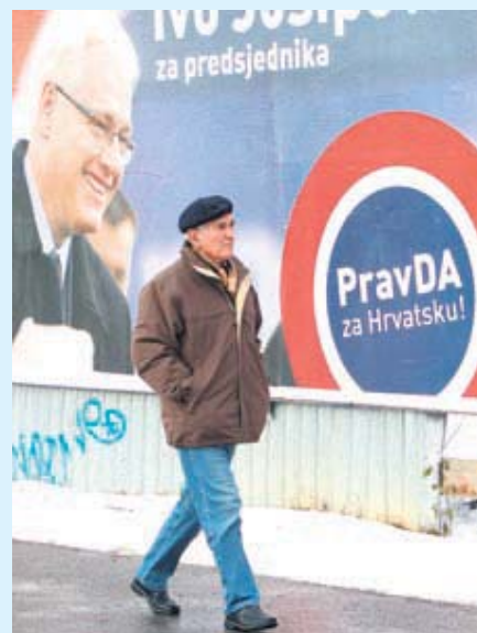
U šetnji zagrebačkom ulicom

Takva promišljanja i stavovi takvih osoba najveća su opasnost "RAK RANA" za svaki normalan sindikat kao i njegovog predstavnika, budući da ga takvi radnici sputavaju u bilo kakvoj aktivnosti koju će eventualno morati pokrenuti protiv poslodavca. Na sreću, u svakoj takvoj priči uvijek ima i "pravice"... kad-tad takvi radnici budu uhvaćeni u vlastitoj mreži oportunizma gdje tada pokušavaju na sve moguće načine izboriti pomoć i takvog sindikata kojega su do jučer negirali, u najmanju ruku omalovažavali. Vjerujemo da takvim pojedincima naprosto dolazi voda do grla jer i oni sami uviđaju da uživaju nepravedno prava koja ne zaslužuju, da im polako nedostaje potpora moćnika kod kojih su se zadužili s kratkim vremenskim peri-