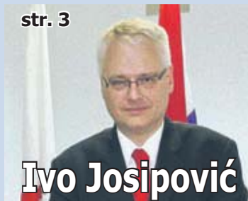
Ivo Josipović predsjednik RH