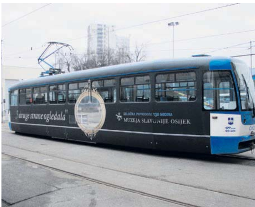
Iz rada GPP Osijek