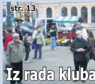
Iz rada kluba umirovljenika ZET-a