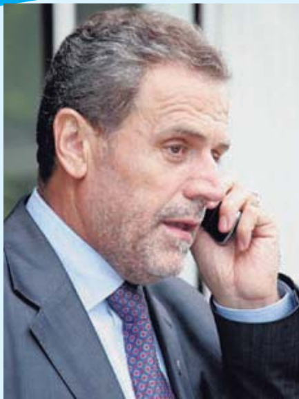
Milan Bandić, zagrebački gradonačelnik

Blagdanski su dani iza nas. Vrijeme IZBORA također. Mnogi naši radnici, pohitali su na godišnji odmor kako bi brže-bolje pribavili naknadu s tog naslova, valjda bojeći se da će se stvarno nešto posebno događati. Znani i neznani naši radnici, predviđaju teška vremena, nedaće pa čak i "bankrot"... ništa novo jer se radnici u ZET-u, koji broje preko tridesetak ljeta sjećaju takvih ili sličnih prognoza, ali kome to i za čiji račun to treba...!??