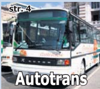
Autotrans Rijeka Potpisan KU