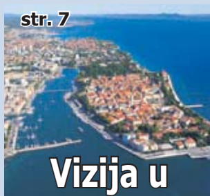
Vizija u Liburniji Zadar