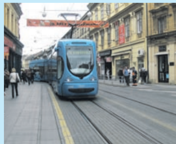
Slika zavoja iz tramvaja...

Problem cviljenja kad tramvaji prolaze zavojima postoji od kada voze tramvaji. Cviljenje stvara veliku neugodu okolnom stanovništvu. Uzrok cviljenju je proklizavanje oba kotača tramvaja po tračnicama jer, kako se nalaze kruto spojeni na istu osovinu, vanjski kotač prijeđe i po nekoliko metara duži put u zavoju od kotača s unutarnje strane osovine.