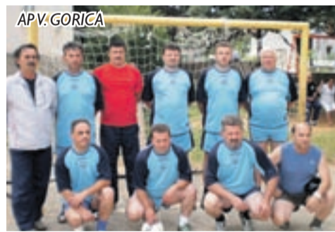
AP V. GORICA