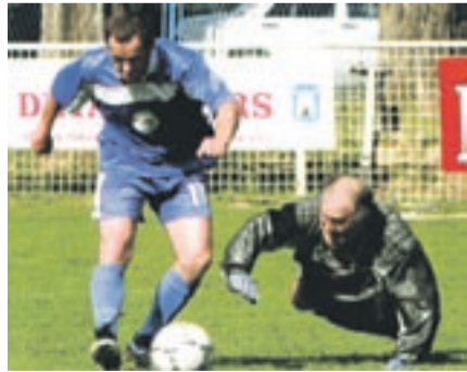
Golman tramvajaca skidao je i zloere, no ipak je dobio dva gola